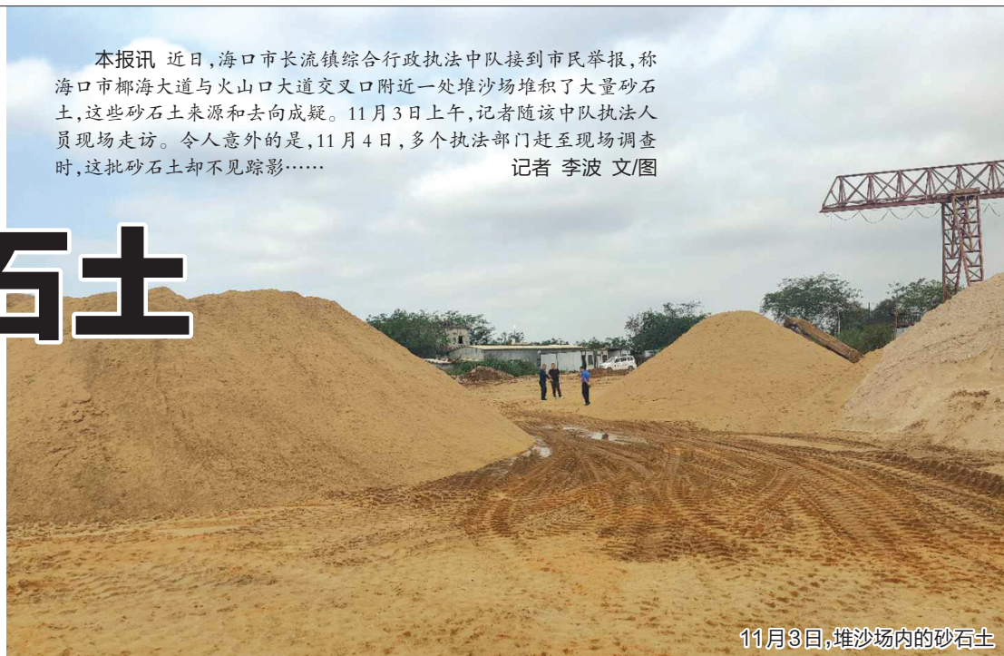
11月3日,堆沙场内的砂石土