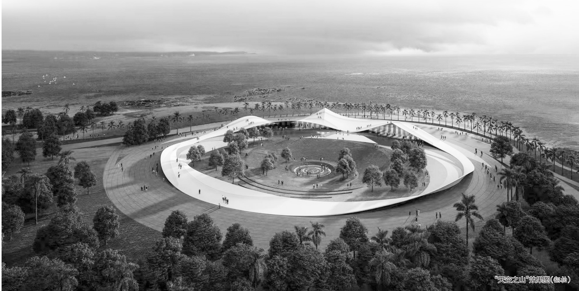
“天空之山”效果图(翻拍)