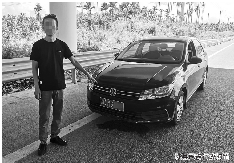
孙某已被行政拘留

6 月 16 日,孙某前来交管大队处理交通违法行为时,工作人员通过公安交通管理综合应用平台核查,发现孙某的驾驶证当前为注销状态,属于未取得驾驶证驾驶机动车。孙某称其曾因吸毒而导致驾驶证被注销。根据《道路交通安全法》相关法律规定,琼海市公安局交通管理大队对孙某未取得驾驶证驾驶机动车的违法行为处以罚款 1500 元,行政拘留 15 日的处罚。