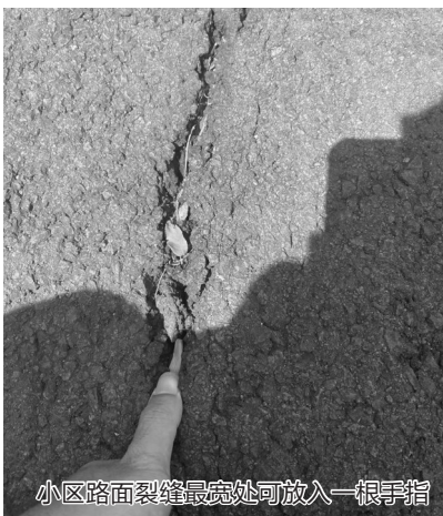
小区路面裂缝最宽处可放入一根手指