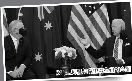
21日,拜登与马克龙在纽约会面

法国总统马克龙21日也取消了在联大进行视频演讲的计划。法德两国高官当天在欧盟部长会议上表示,近期事态是一记警钟,强烈提醒欧盟必须强化自主行动的能力。自美国前总统特朗普屡次撕裂跨大西洋同盟之后,美欧关系再次陷入危机。 新民