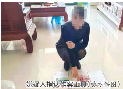
嫌疑人指认作案工具