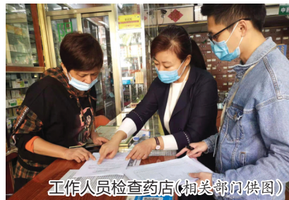
工作人员检查药店