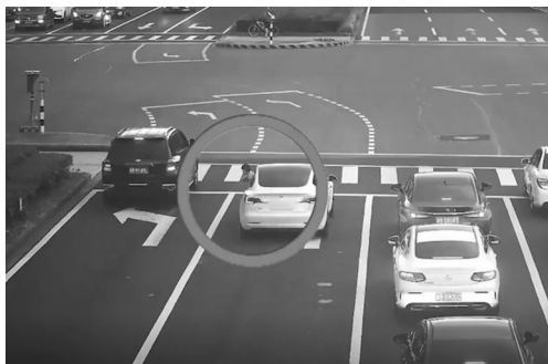
小孩探出半个身子