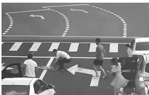
多位车主赶来救援