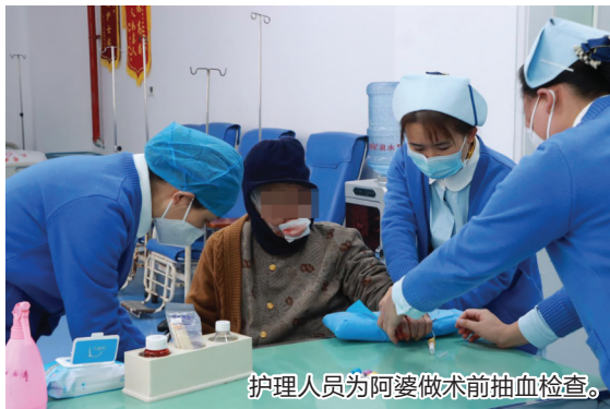
护理人员为阿婆做术前抽血检查。

1月29日下午3时许，海口市文明东路潮立方公交站十字路口发生一起摩托车撞上一名路人的事故。路人与肇事司机双双倒在血泊中，周边车水马龙，不少群众上前围观。