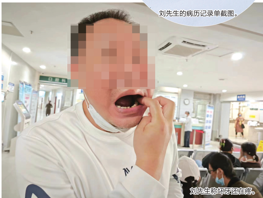
刘先生称坏牙还在疼。