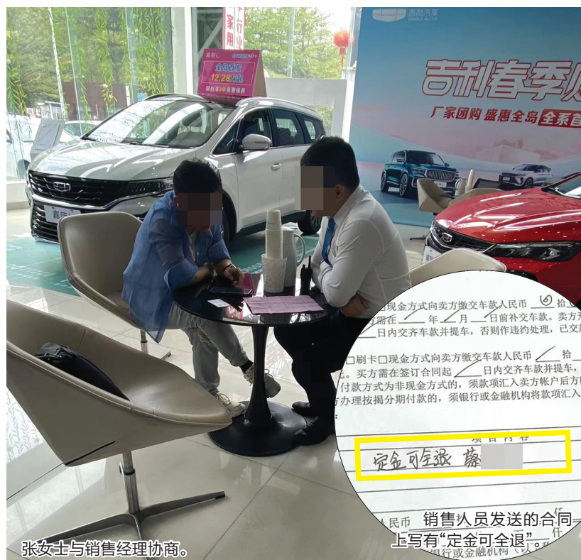
张女士与销售经理协商。

针对此事，海口市市场监管局秀英分局相关工作人员表示，如果消费者违约，商家可以不退定金；如果合同上另有约定可退还定金，则以合同约定为准。