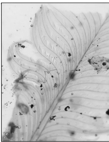
成对出现的羽轴主导型羽,有着非常飘逸的形态