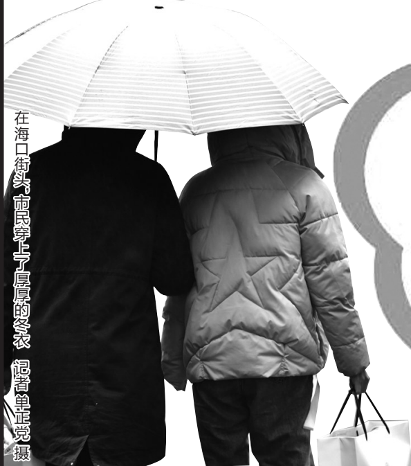
在海口街头，市民穿上厚厚的冬衣。