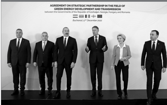
罗马尼亚总理丘克、匈牙利总理欧尔班、阿塞拜疆总统阿利耶夫、罗马尼亚总统约翰尼斯、欧盟委员会主席冯德莱恩和格鲁吉亚总理加里巴什维利(从左至右)合影。 新华社发

据介绍,这条500千伏的格鲁吉亚-罗马尼亚黑海海底电缆总长1100多公里,造价约20亿欧元。格鲁吉亚已从世界银行获得对该项目的可行性研究资金,可行性研究计划将于2023年年底完成,电缆计划于2029年年底投入使用。