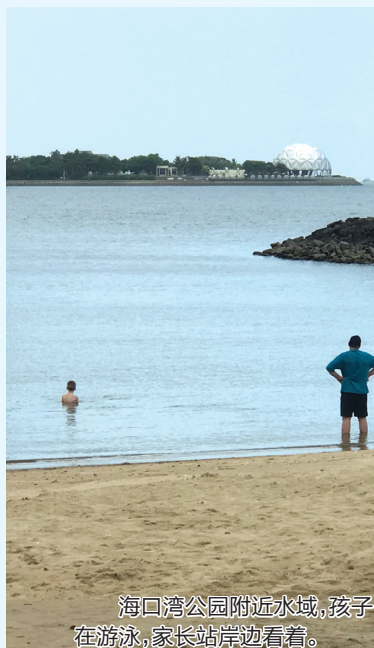
海口湾公园附近水域，孩子在游泳，家长站岸边看着。