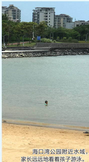
海口湾公园附近水域，家长远远地看着孩子游泳。