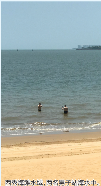
西秀海滩水域，两名男子站海水中。