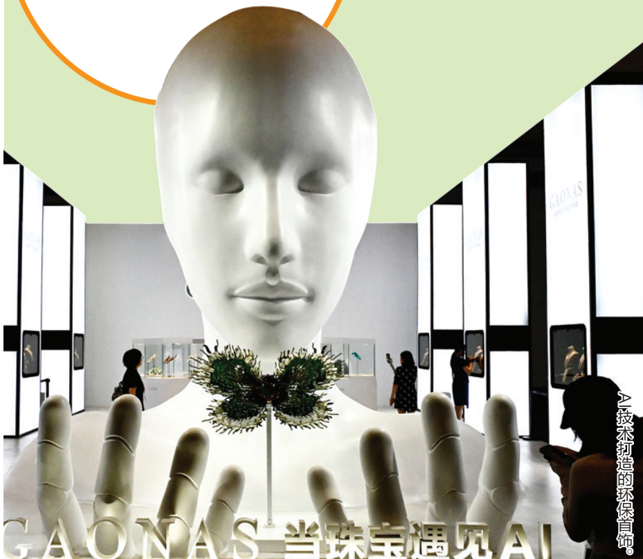
AI技术打造的环保首饰。